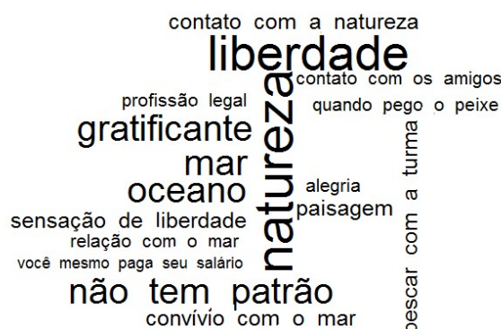
Figura 2: Motivos para gostar da profissão.

Ao serem questionados se gostam da profissão, a maioria dos entrevistados (N=5) afirma que sim e os motivos (Figura 2) estão relacionados ao contato com a natureza, a convivência no trabalho com os amigos e ao sentimento de liberdade. No que se refere aos motivos para não gostar da profissão, são mencionados a pesca predatória, a escassez de pescado e o fato de atualmente a pesca não garantir autossuficiência financeira.